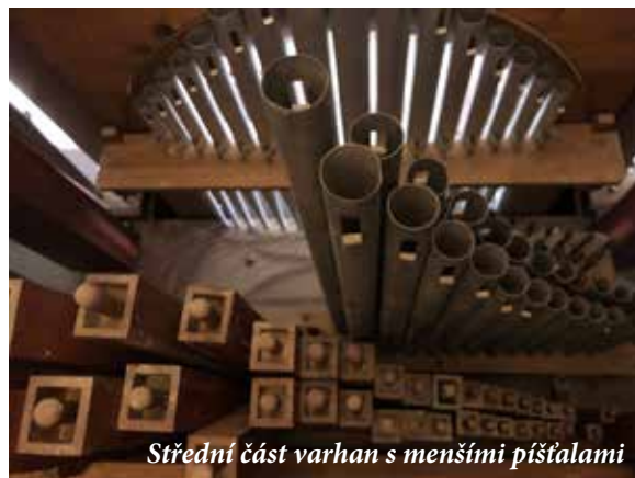
Střední část varhan s menšími píšťalami