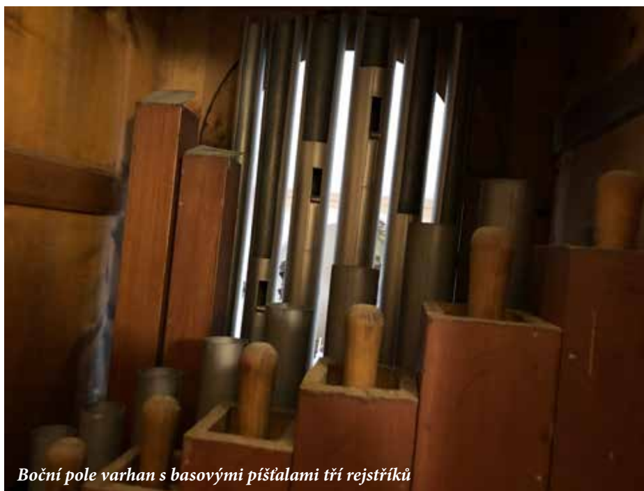
Boční pole varhan s basovými píšťalami tří rejstříků

Vaše varhany by nyní potřebovaly vyčistit, zkontrolovat 282 píšťal, u dřevěných zkontrolovat těsnění a dále zkontrolovat měch, zda je v pořádku. Nakonec by se dal nový motor a umístil by se v kostele, místo na půdě, kde je doposud, protože to