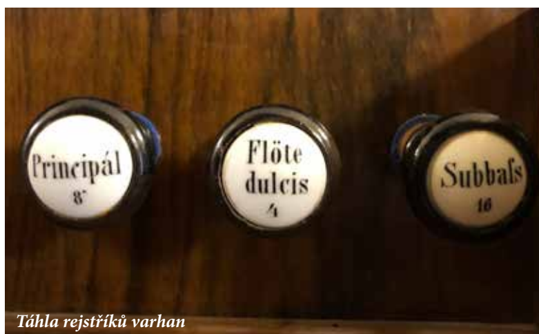
Táhla rejstříků varhan