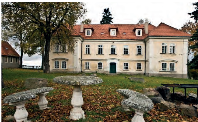
Takto to přibližně vypadalo v době, kdy se zámek vracel původním vlastníkům v restituci.

Oaks Prague nabízí rezidenční bydlení v nádherné lokalitě s historií, kde si na své přijdou nejen milovníci golfu. Projekt přináší řadu benefitů i občanům Nebřenic, Chomutovic, Popoviček a dalších obcí. Vzniklo nové náměstí, které slouží jako prostor pro pořádání kulturních akcí, a kolem přibývají nové obchody a služby. Místní si už stihli oblíbit například restauraci La Bottega Oaks Deli Bistro. Důležité je také zmínit, že Oaks Prague nezapomíná ani na ekologii. A nejde jen o velké investice do nové čistírny odpadních vod i vodovodního přivaděče, ze kterého budou v případě nedostatku vody těžit i okolní obce. Přispívá totiž také zdanlivými maličkostmi, jako jsou například včelí úly – na ty si ale posvítíme zase příště.