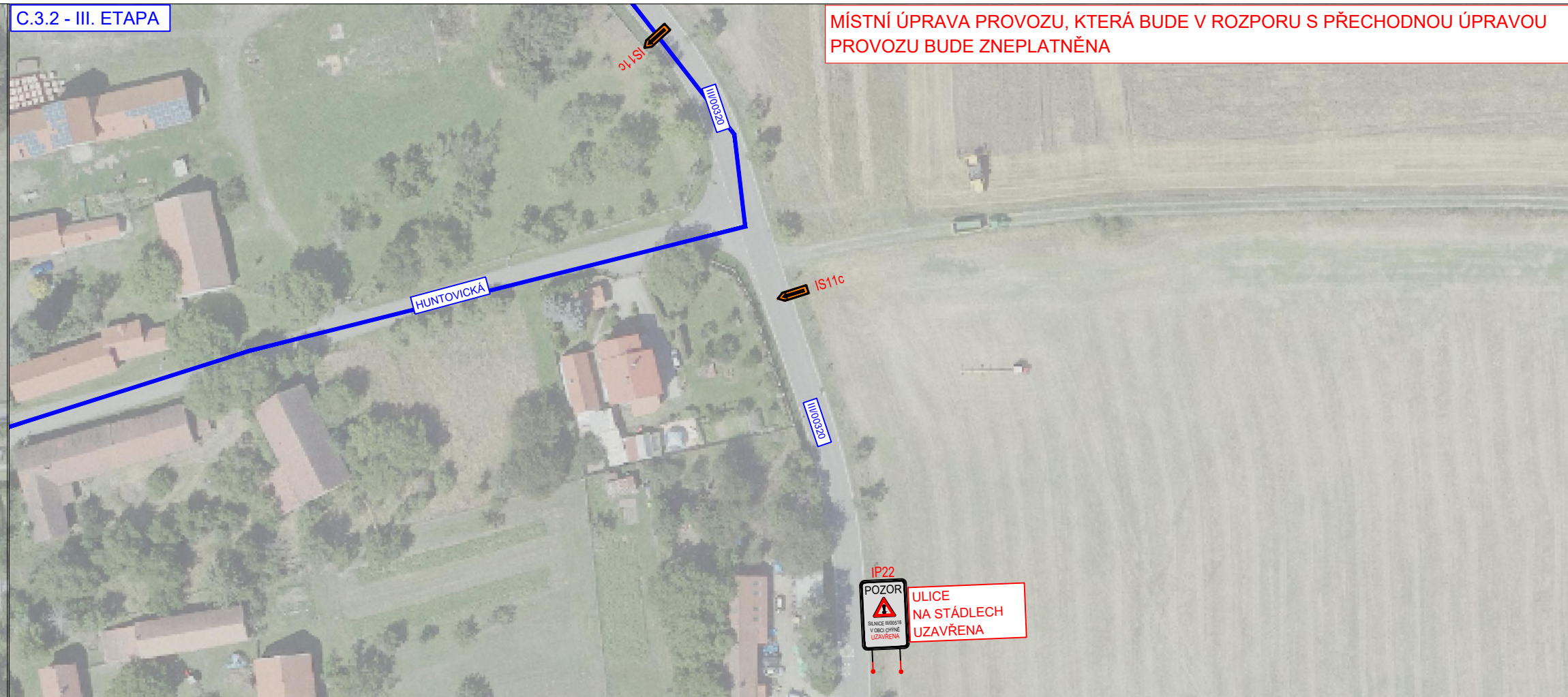
C.3.2 - III. ETAPA