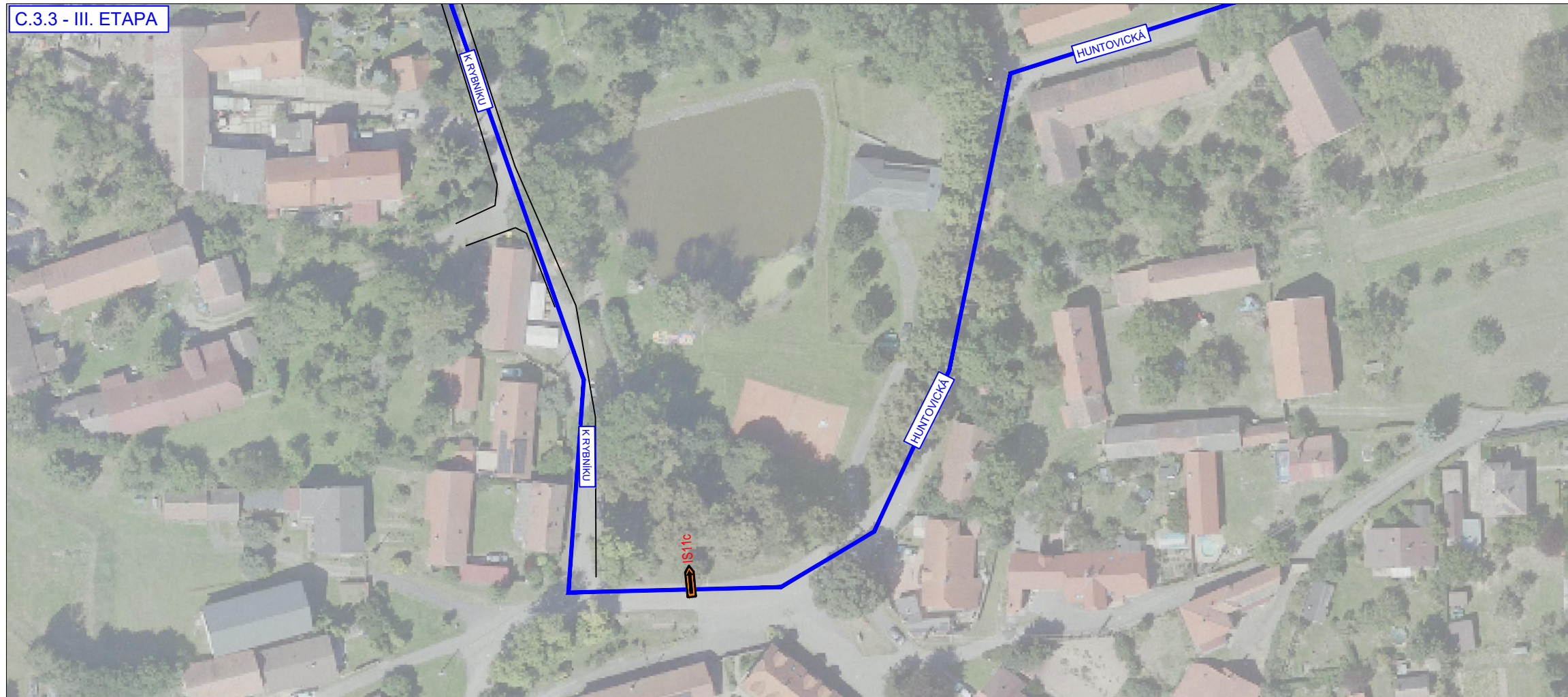
C.3.3 - III. ETAPA