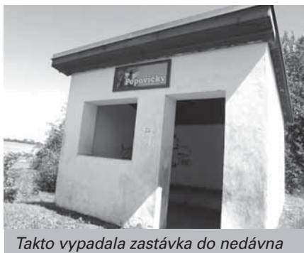
Takto vypadala zastávka do nedávna