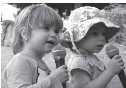
Kdo ví, zda tyto zpěvačky neodstar-tovaly v Chomutovicích svou kariéru