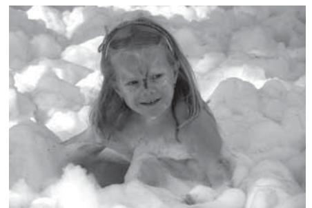
Bílé závěje z hasičské pěny na rozdíl od sněhu ani trochu nestudily