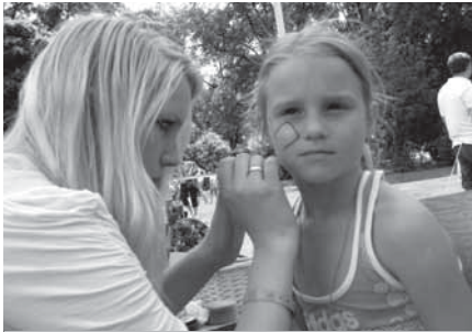
Malování na obličej patřilo na oslavě MDD k největším atrakcím