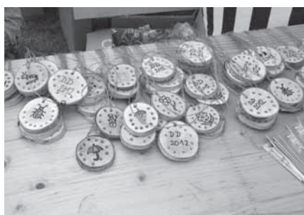
Tentokrát záhy zmizela i železná rezerva originálních dřevěných medailí