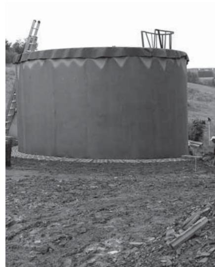
Na vodojemu jsou již instalovány veškeré technologie, dokončují se jen terénní úpravy v jeho okolí