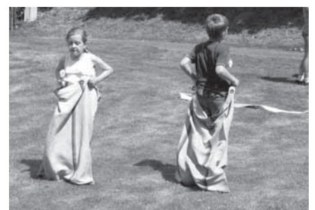
Skákání v pytlích se obešlo bez úrazů a postaralo se o spoustu zábavy