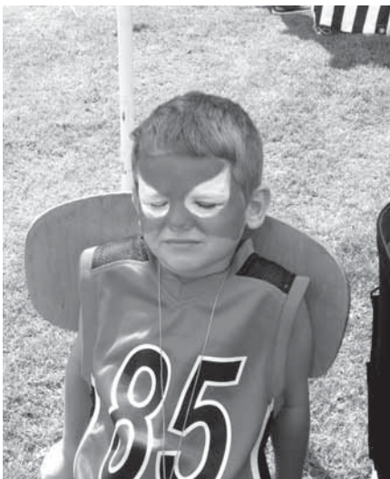
Proměna tohoto kluka ve filmového hrdinu byla záležitostí několika minut