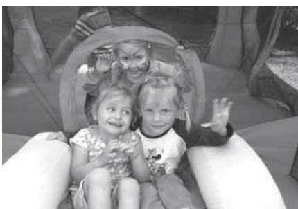
Na skákacím hradu vydržely některé děti skotačit i dlouhé hodiny