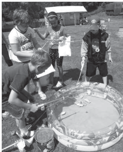
S lovením rybiček pomáhali dětem u nafukovacího bazénku rádi i rodiče