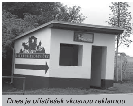
Dnes je přístřešek vkusnou reklamou