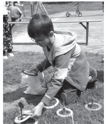
Házení kroužků na cíl dalo mnohým soutěžícím pořádně zabrat