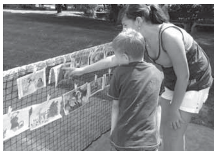
Pohádkové hrdiny i státní vlajky muse-ly děti poznat na „vědomostní síti“