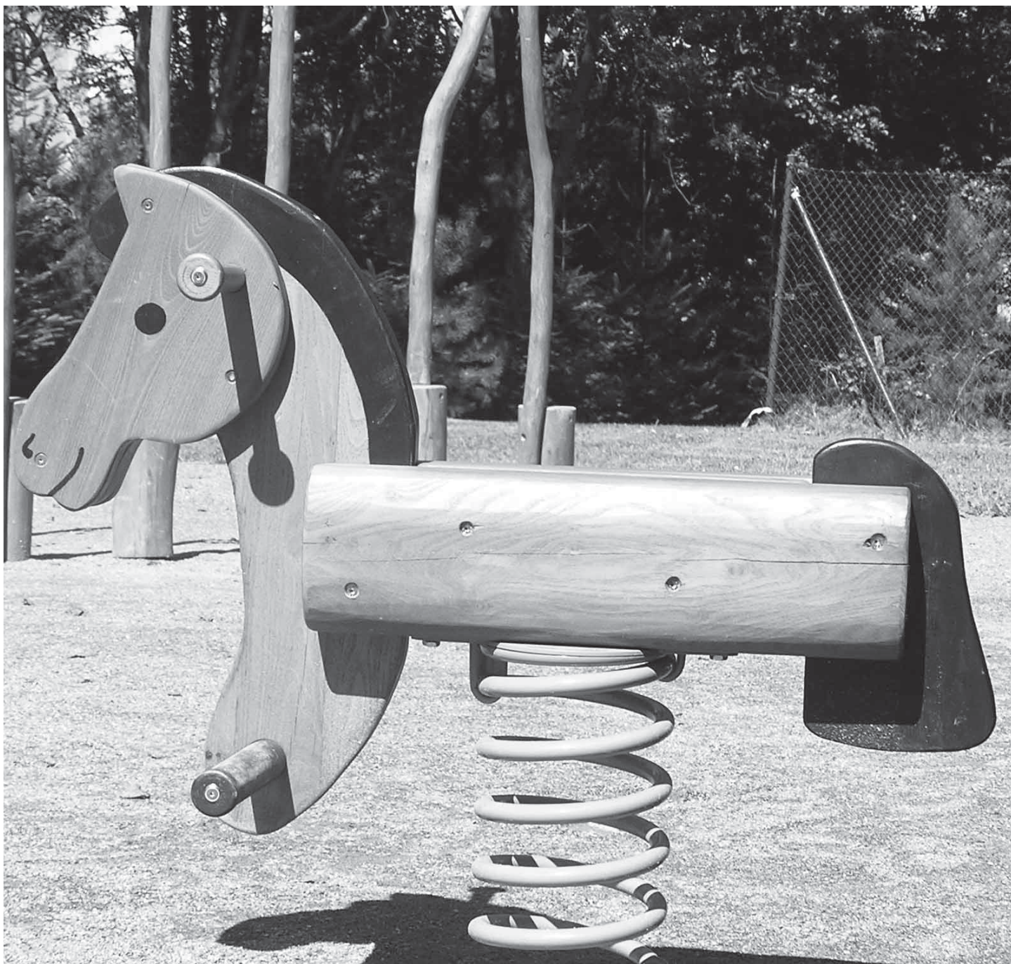
Na novém dětském hřišti v Popovičkách nebude mít nikdo na zlobení ani pomyšlení