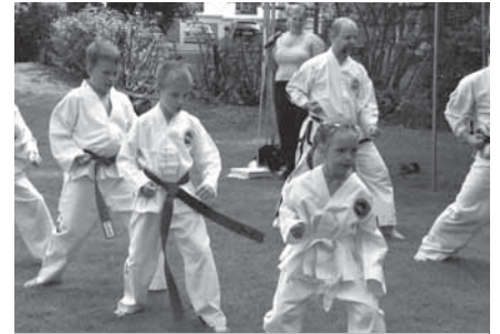
Mistrovské bojové umění předvedli i nejmenší členové oddílu Kwang-Gae