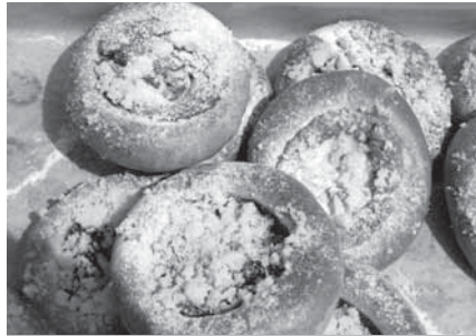
Nejen malinové koláče od paní Malinové přišly k chuti každému