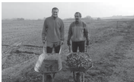
Sousedé stihli udělat spoustu práce a navíc si při práci ještě popovídali.