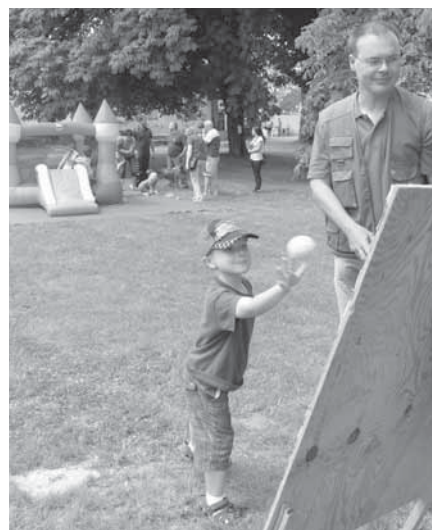
Prima zábavu si na mysliveckém odpoledni mohl v Nebřenicích užít úplně každý. U některých soutěží se odehrávaly i rodinné souboje.