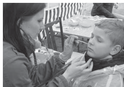
Bez malování na obličej už si Dětský den nikdo neumí představit. Výtvary vizážistek odolávaly dešti stejně statečně jako děti.