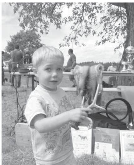
Skutečně srnčí parůžky držela většina dětí v ruce vůbec poprvé v životě. A zcela nová byla i většina dalších zážitků.