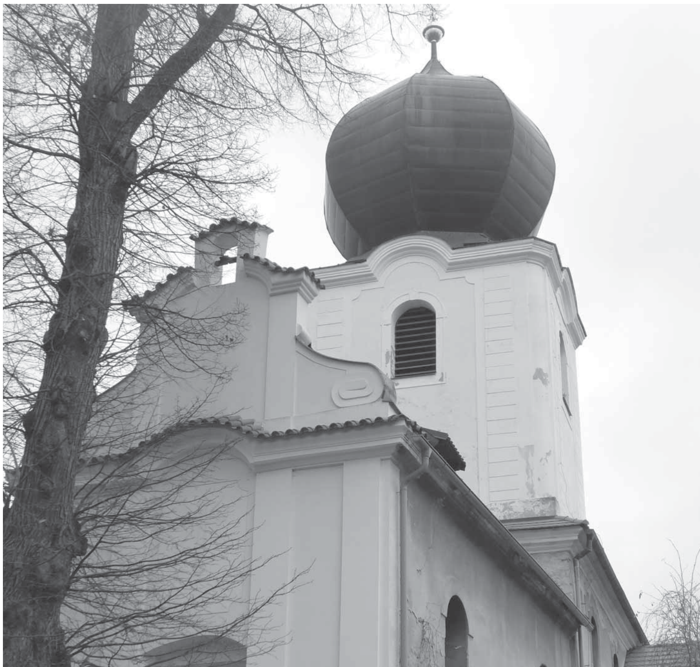
Martin na bílém koni nepřijel, ale náš kostel se jistě zimního kabátu dočká co nevidět.