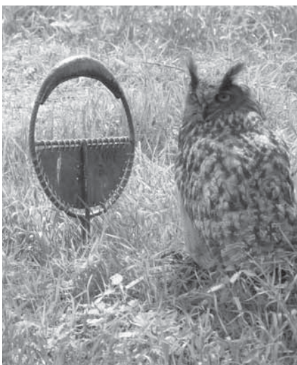
Den myslivosti v Nebřenicích byl současně i dárkem k MDD. Děti se tu mohly setkat i s dravými ptáky a sovami.