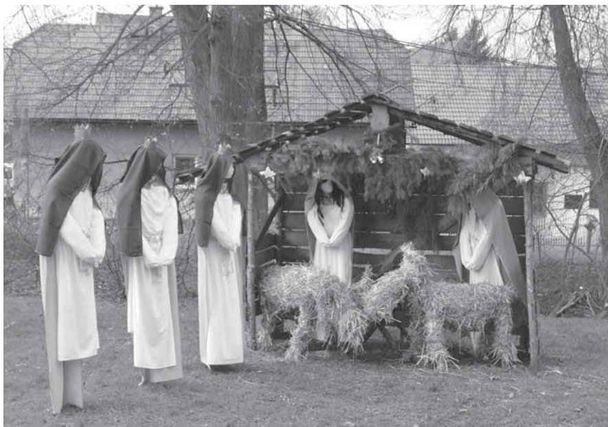
Ani letos nechybí na chomutovické návsi přírodní betlém. Hlavní část adventní výzdoby stačily místní ženy připravit v závěru podzimní brigády. Vánoční strom dozdobily společně s hasiči hned další sobotu. Na první adventní neděli bylo tedy vše v gala.

Náš sbor zde důstojně reprezentoval obec, když jeho zástupci hned dvakrát stanuli na stupních vítězů.