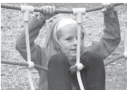
Na hřišti v Popovičkách se děti rozloučily s létem po svém – dováděním. Zázemí k tomu měly náramně.