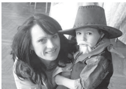
S dětmi se po celou dobu dobře bavili i jejich rodiče, protože tak to mělo být. V některých soutěžích si měly pomáhat celé rodiny.