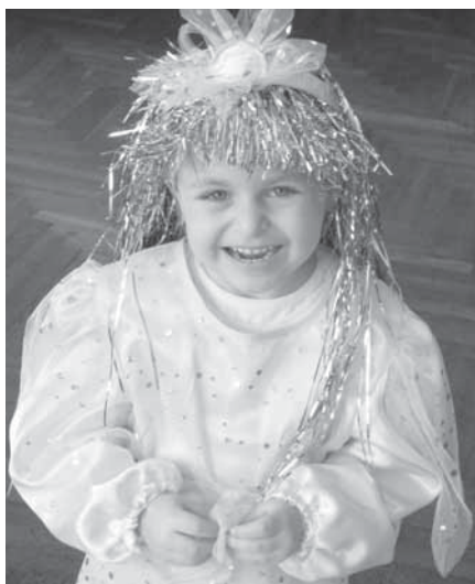
Úsměv ve tváři hrál nejen princezně Zlatovlásce, ale všem klukům a holčičkám. Soutěžní úkoly plnili s nadšením.