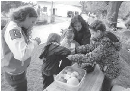
U pultíku s ovocem a zeleninou se kupodivu nenakupovalo. I tady bylo třeba dokazovat především znalosti.