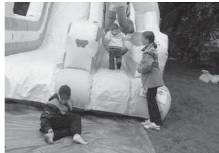
Obří skluzavka se kvůli počasí změnila ve vodní tobogán. Dětem to ale vůbec nevadilo. Rýmu našťestí nikdo nedostal.