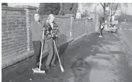
Zamětání, hrabání listů a úklid nepořádku v obci i jejím okolí. Tradiční scénář brigády.

Děkujeme, že Vám není vzhled našich obcí lhostejný!