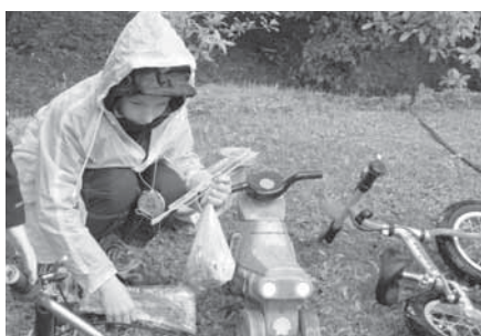
Na dětském dnu museli všichni kvůli počasí absolvovat „pláštěnkovou“ a „deštníkovou“ mokrou disciplínu.