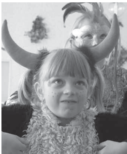
Na karnevalu se sešli čerti a čertice, princezny, závodníci, zvířátka a další krásné masky. Důležité bylo, že si odpoledne všichni užili.

Fotografie potvrzují, že jim tady bylo a je opravdu dobře.