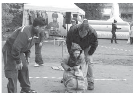
Děšť a bláto dětem nevadily, soutěžily o sto šest. Skákání v pytlích však bylo i skákáním mezi kalužemi.