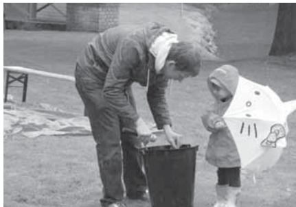
Není voda jako voda. Ta ve kbelíku byla trochu kouzelná. Daly se z ní totiž dělat krásné obří bubliny.