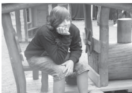
Že je hřiště Na Stádlech jen pro prfata? Omyl. Jen se nikdo nesmí dívat, když se tady baví „náctiletí“.