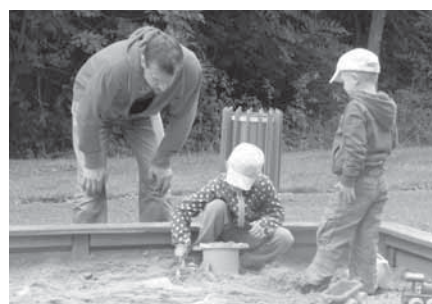
Kyblíček, lopatka a bábovičky. Náčiní a zábava, které asi nikdy nikoho neomrzí. Na pískovišti se vracejí do dětství i dospělí.