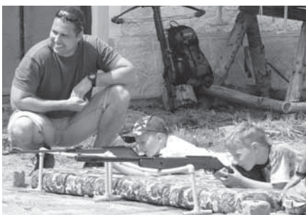
Střelba ze vzduchovky byla velkou atrakcí hlavně pro kluky. V „palební pozici“ by klidně dokázali ležet i celé hodiny.