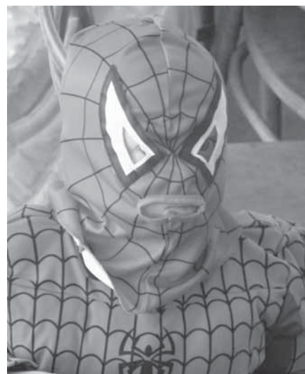
Na některých maskách a kostýmech bylo znát, že se dnešní hrdinové dost liší od těch, které známe z pohádek.