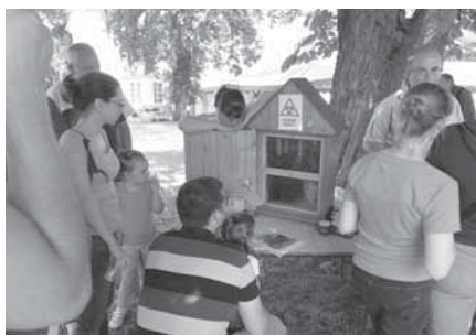
V Nebřenicích se dalo nahlédnout i do včelích úlů. Děti se tady také o včelách a medu dozvěděly spoustu zajímavých věcí.