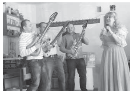
Tatínkové svým dětem dokázali, že se umí pěkně odvázat. Vůbec nevadilo, že kytary byly nafukovací a oni hráli jen tak „jako“.