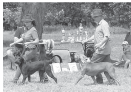
Myslivci a lovečtí psi patří k sobě. Na Dnu myslivosti návštěvníkům společně předvedli, co všechno dovedou.