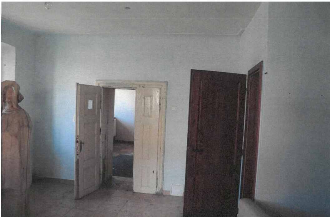
Popovičky, fara čp. 1, interiér fary se zachovanými dveřmi a pozůstatky štukových stropních rámců