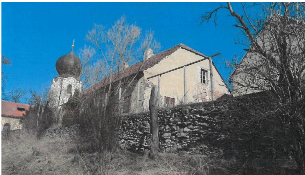
Popovičky, fara čp. 1, fara, pohled z jihozápadu