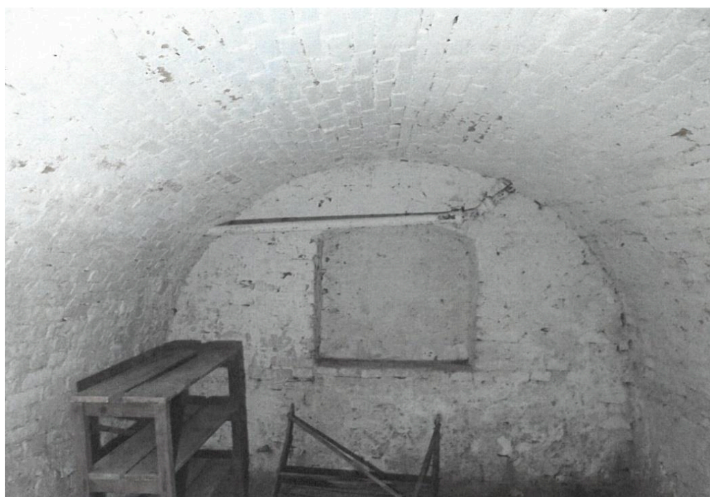
Popovičky, fara čp. 1, západní sklep