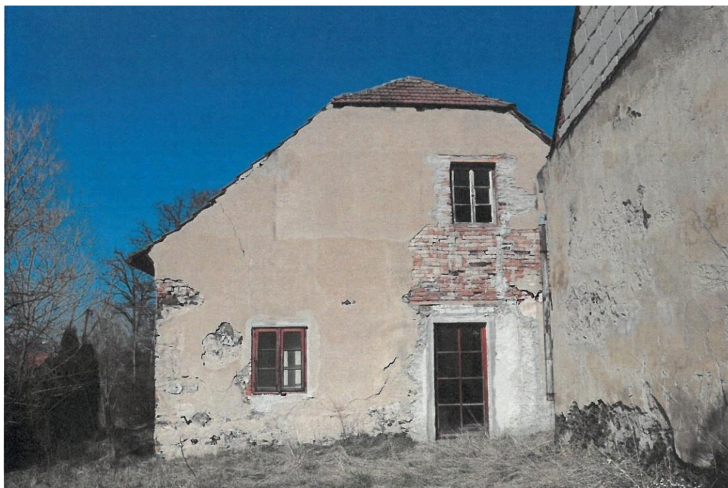
Popovičky, fara čp. 1, jižní fasáda fary a západní fasáda hospodářského objektu, pohled z jihu.