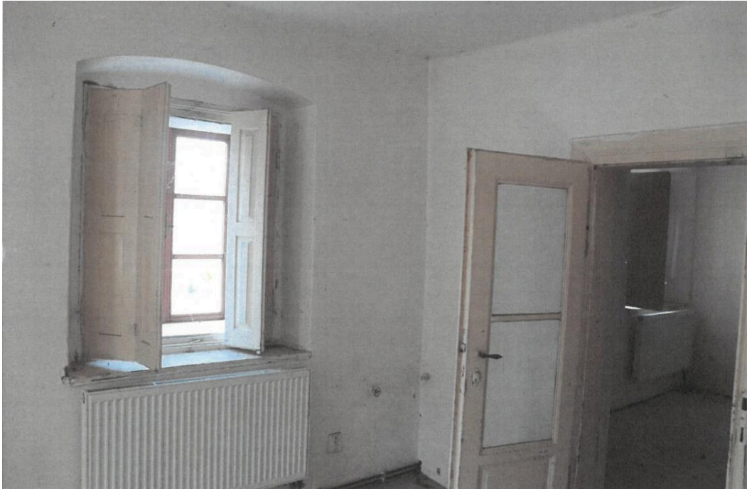
Popovičky, fara čp. 1, interiér fary se zachovanými okenními okenicemi a dveřmi