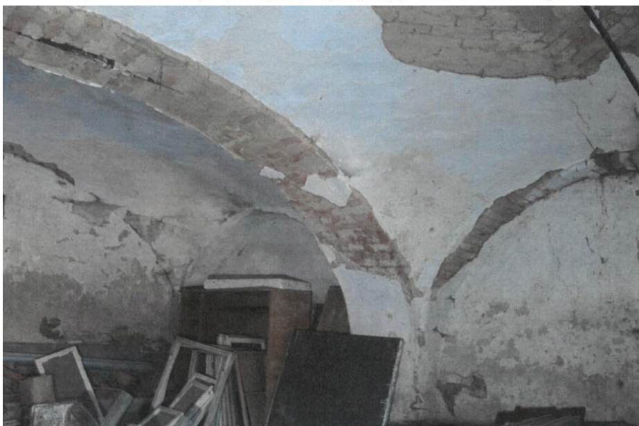
Popovičky, fara čp. 1, hospodářský objekt, pohled do jedné z místností,