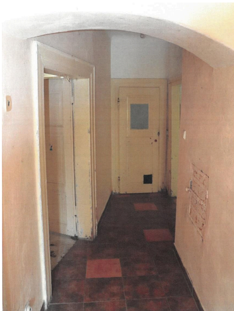
Popovičky, fara čp. 1, chodba středního traktu, pohled od hlavního vstupu,