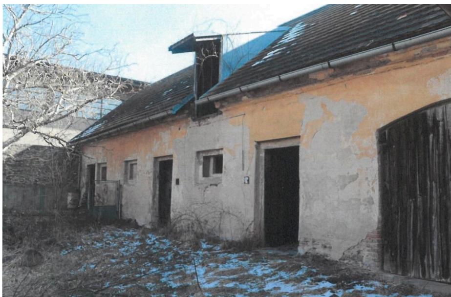
Popovičky, fara čp. 1, hospodářský objekt, pohled ze severozápadu,