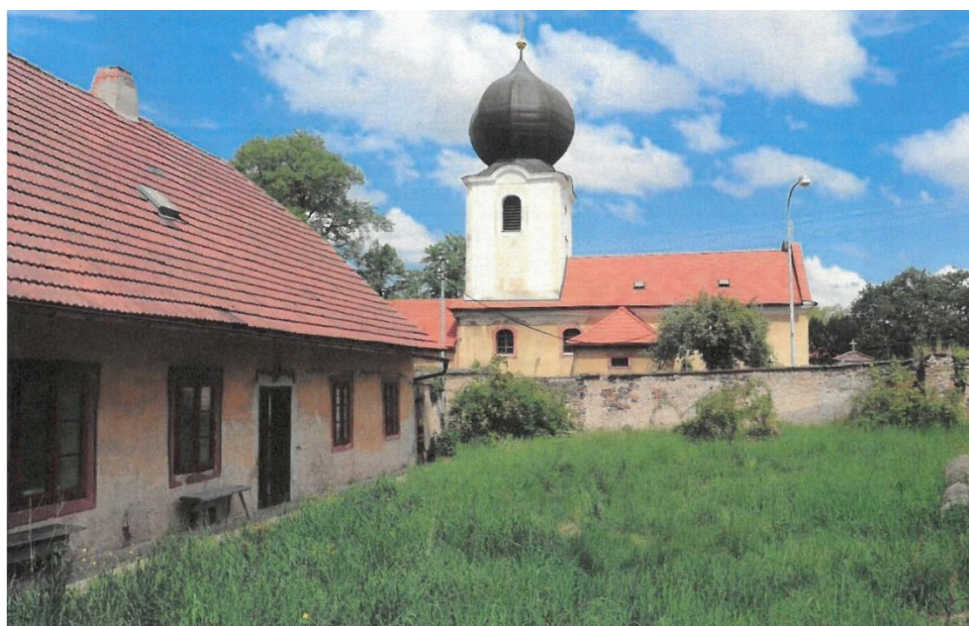
Popovičky, fara čp. 1, východní (hlavní) průčelí fary směrem do dvora a kostel sv. Bartoloměje, pohled z jihovýchodu,