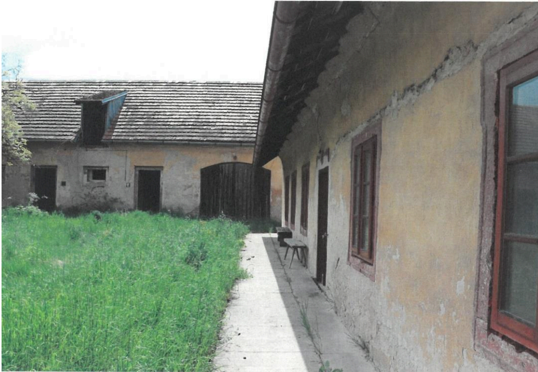
Popovičky, fara čp. 1, pohled na východní průčelí fary a hospodářský objekt, dvůr, pohled ze severu,