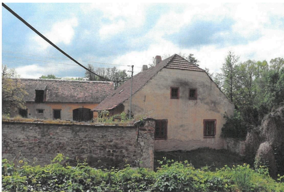
Popovičky, fara čp. 1, fara s hospodářským objektem v pozadí a ohradní zdí, pohled ze severu,

Areál je ze severu a východu uzavřen ohradní zdí nesoucí pozůstatky zaniklých komunikačních otvorů. Při pohledu ze silnice je v severním lici zdi zřetelný zazděný vstup, stejně tak úsek zdiva vycházející do prostoru dvora. Ten by snad mohl souviset se strukturou zaniklého objektu stodoly. Zatímco jsou dnes kovaná vrata umístěna ve východním úseku zdi, původně byla osazena v jejím západním úseku, tj. při dnešní brance na dvůr a při severovýchodním nároží fary. Zazdívka původních vrat, doložených také nákresem z r. 1867, je stále zřetelná a zjevně k ní bylo užito i starších, pravděpodobně barokních, architektonických článků.