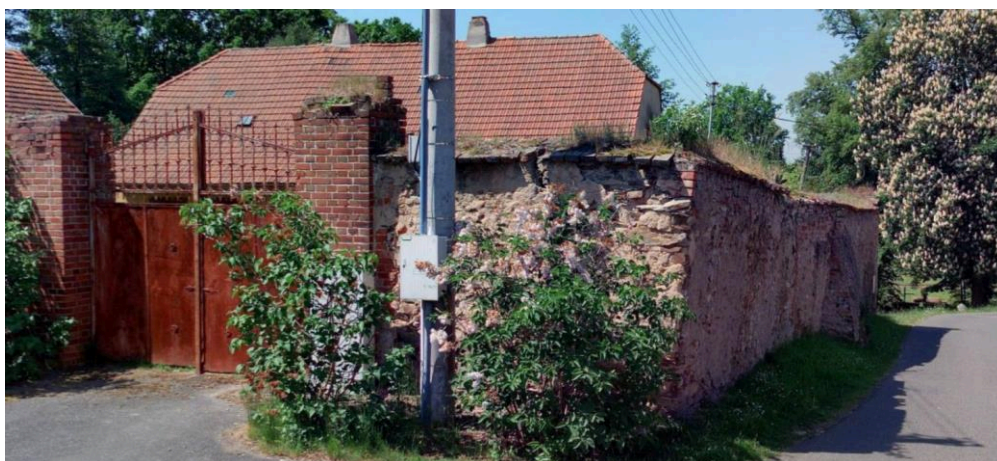
Ohradní zeď s bránou