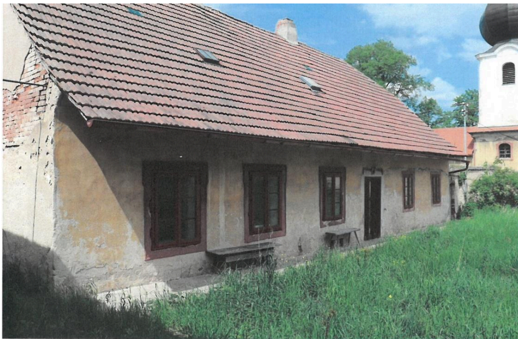
Popovičky, fara čp. 1, východní průčelí fary a pohled na dvůr, v pozadí kostel sv. Bartoloměje, pohled z jihovýchodu,