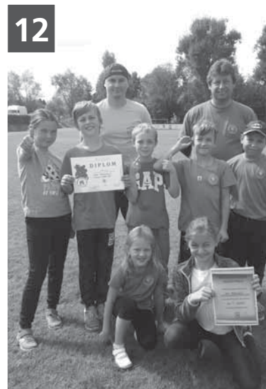
Tradiční nohejbalový turnaj o putovní pohár