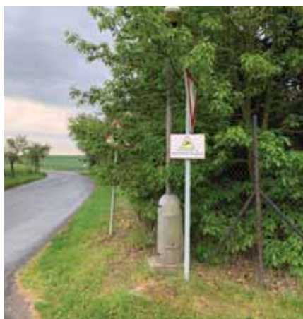
Ulice K návsi