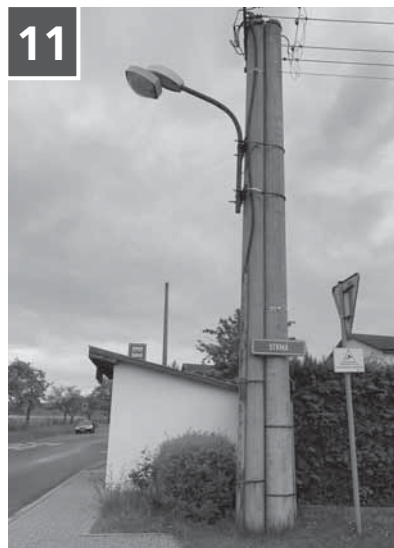
Naše poprvé – doslovná zkouška ohněm