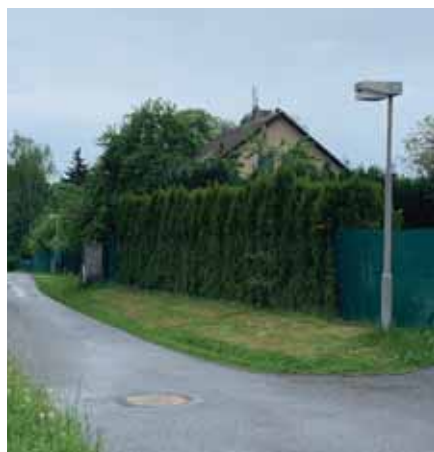
Ulice Do polí