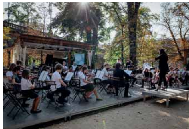
Koncert orchestru NF Harmonie na Střeleckém ostrově